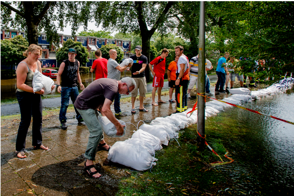
Buurtbewoners helpen bij wateroverlast

Anders dan bijvoorbeeld in bepaalde Amerikaanse staten, wordt in ons rechtssysteem een burger die een ander probeert te helpen en daarbij fouten maakt, in beginsel niet aansprakelijk gehouden voor de (extra) schade die daardoor ontstaat. Dat geldt zowel binnen het straf- als het civiele recht. De 'barmhartige Samaritaan' wordt door het recht niet ontmoedigd. Pas als sprake is van echt roekeloos gedrag bij de hulpverlening komt eventueel de aansprakelijkheid in het vizier. Bij strafbare overtredingen zal vaak sprake zijn van een rechtvaardigingsgrond. Zonder duidelijke noodzaak zal men strafrechtelijk aansprakelijk zijn voor een snelheidsovertreding, maar als het een kwestie van leven of dood is, kan het gerechtvaardigd zijn.