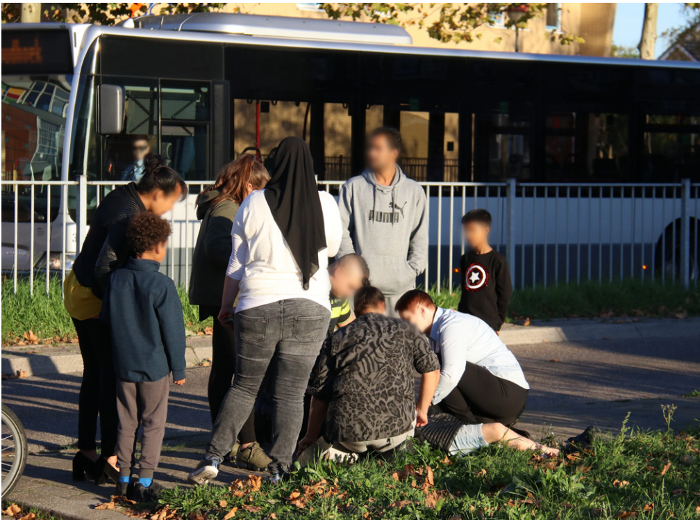
Omstanders verlenen eerste hulp na aanrijding