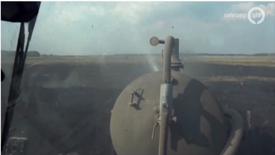
Inzet van een boer met giertank bij natuurbrandbestrijding